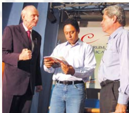
Entrega de um presente ao Ministro e ao Governador.