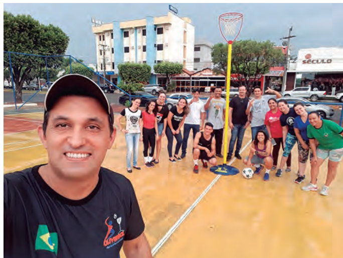
Formação em Oliverbol, com professores da Educação Infantil e Fundamental I e II da rede municipal de ensino

Formação continuada para professores - Foram proporcionadas três formações do Oliverbol para os professores da Rede Municipal de Ensino de Sorriso, ocasião em que tiveram a oportunidade de conhecer as regras do jogo, suas características e, principalmente, vivenciar o novo esporte. A ideia é ofertar uma modalidade inovadora nas aulas de Educação Física, incentivando a participação dos alunos envolvidos.